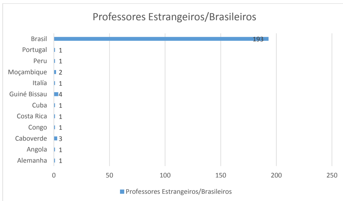
Quadro 3 – Relação docentes brasileiros/docentes estrangeiros