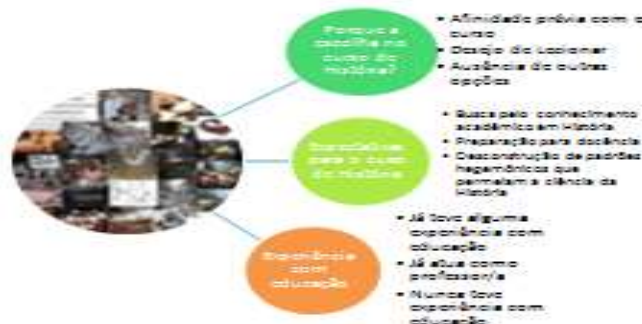
Figura 2: Parte das questões presentes no questionário